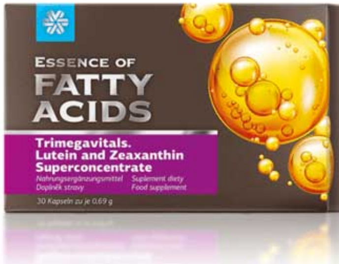
Trimegavitals. Lutein and zeaxanthin