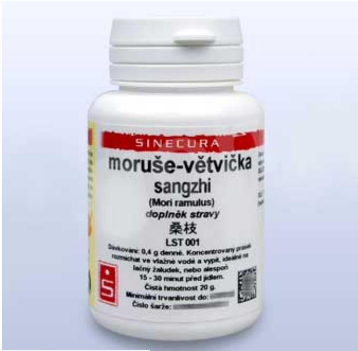
moruse vetvicka instantni prasek